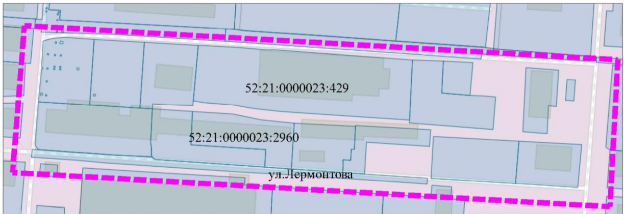
Схема границ подготовки документации по планировке территории