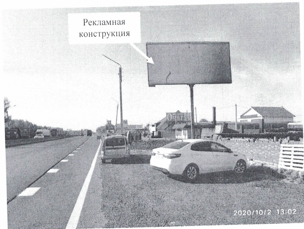
Фото № 1: Панорамный вид размещения рекламной конструкции.

Фотофиксация рекламной конструкции без эскизного изображения, расположенной по адресу: Федеральная дорога М7, 393 км + 820 м (левая сторона).