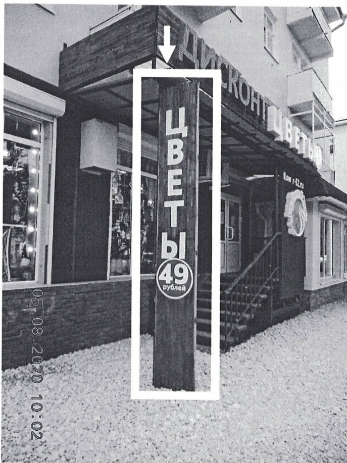
Фото № 2: Панорамный вид размещения рекламной конструкции