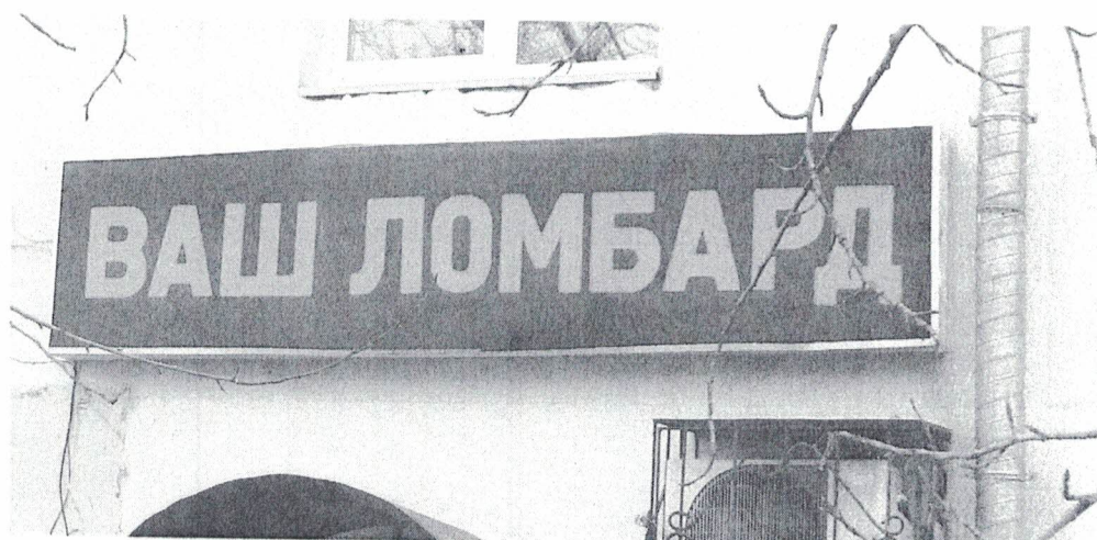
Фото № 2: Эскизное изображение информационной конструкции