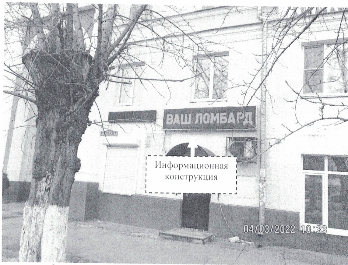
Фото № 1: Панорамный вид-размещения информационной конструкции

Фотофиксация информационной конструкции размером 0,5м х 3,0 м с эскизным изображением «Ломбард», расположенной по адресу: г.Дзержинск, пр.Ленина, д. 65.