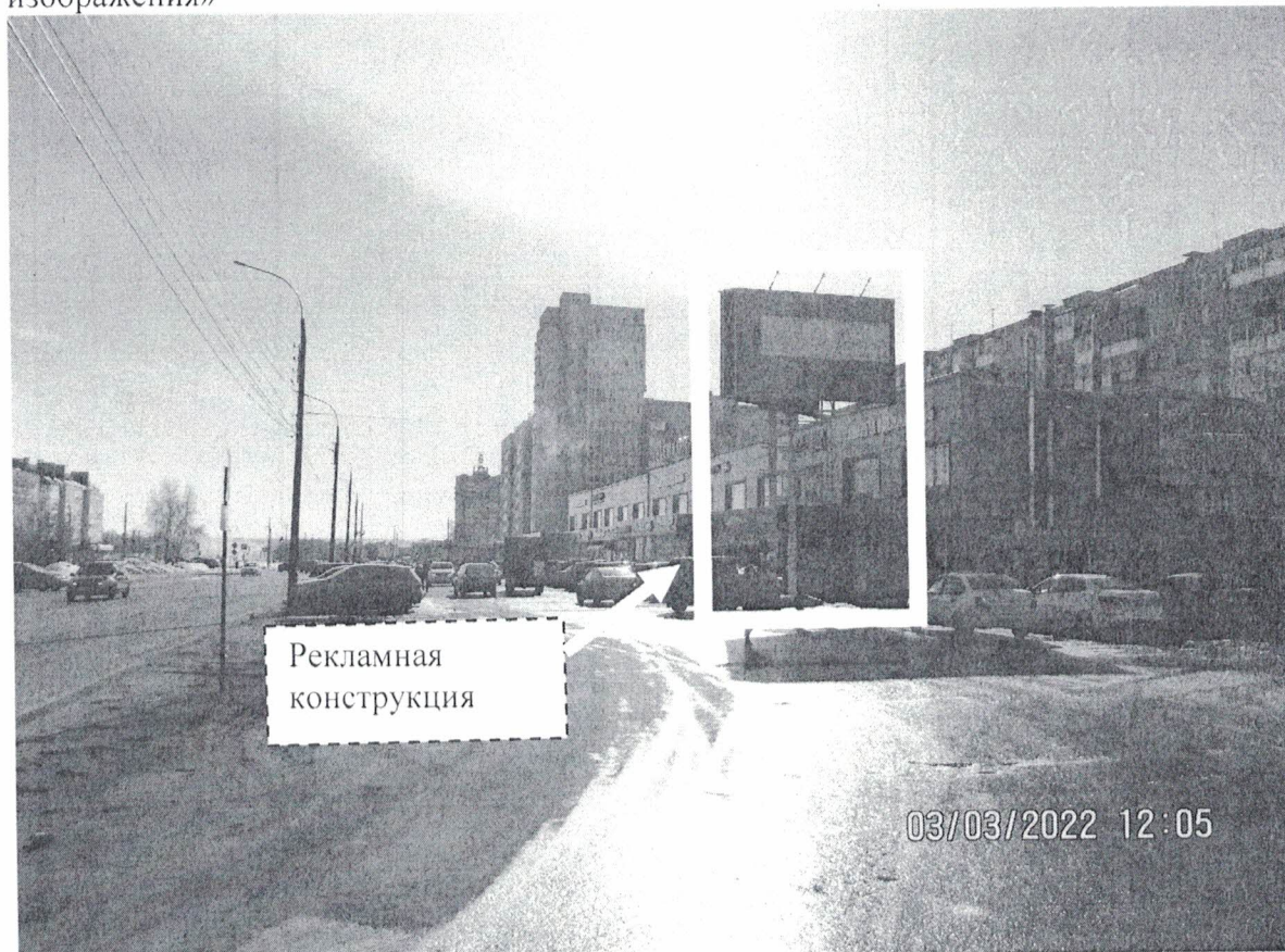
Фото № 1: Панорамное размещение рекламной конструкции.

Фотофиксация места установки (размещения) рекламной конструкции с эскизным изображением «Сторона А: ВАША РЕКЛАМА 8-930-812-39-79 Сторона Б: без изображения»