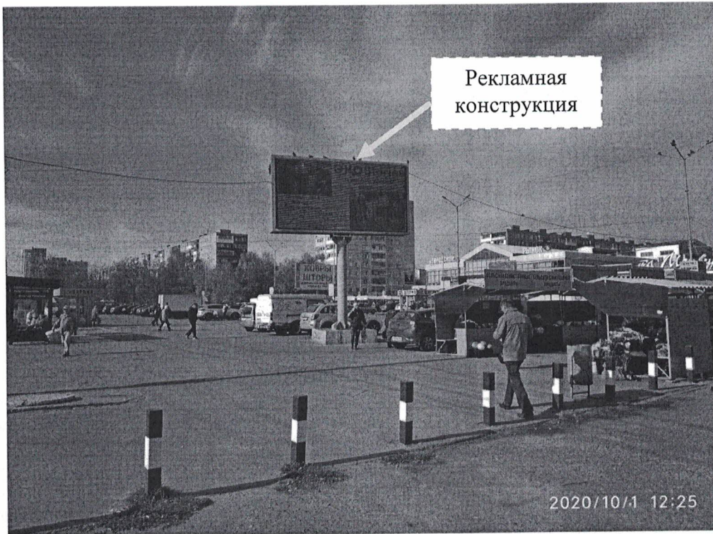
Фото № 1: Панорамный вид размещения рекламной конструкции.

Фотофиксация рекламной конструкции (электронный экран) с динамично изменяемым изображением, расположенной по адресу: Нижегородская обл., г. Дзержинск, пр. Циолковского, в районе д.78.