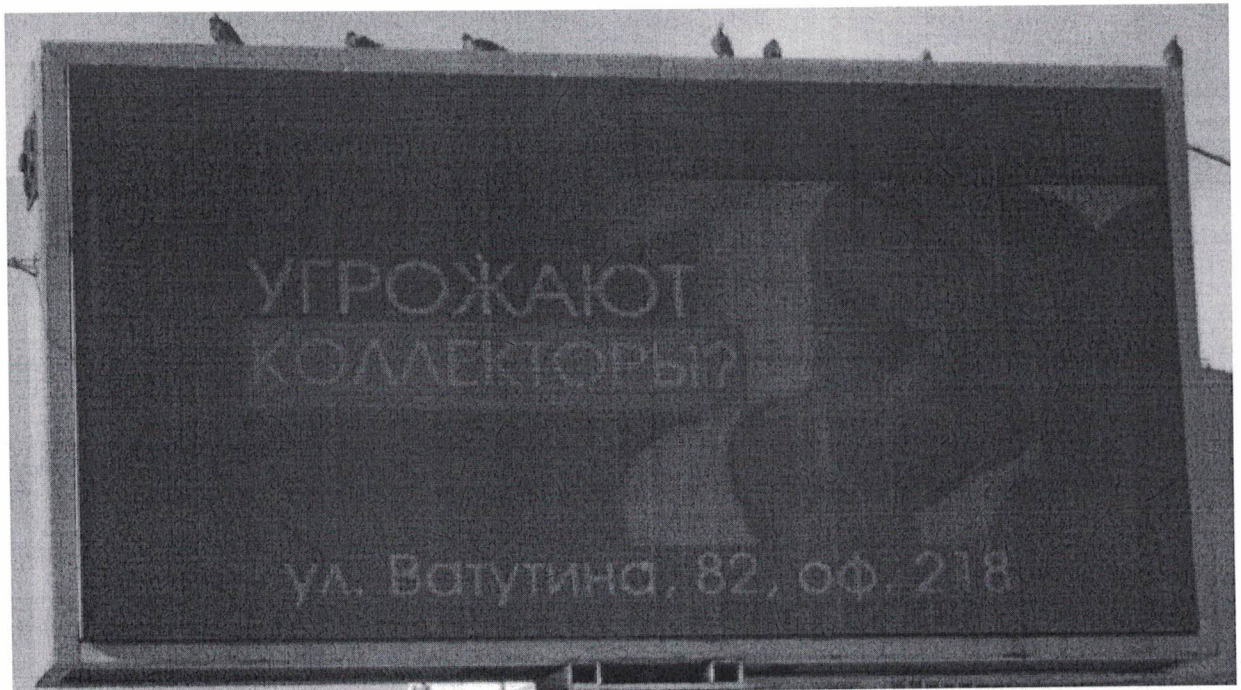
Фото №2: Эскизное изображение рекламной конструкции.