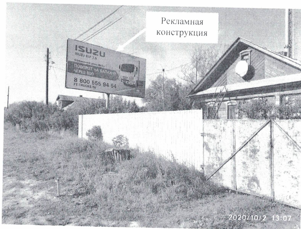
Фото № 1: Панорамный вид размещения рекламной конструкции.

Фотофиксация рекламной конструкции с эскизным изображением «ISUZU/ isuzu elf 7.5. Официальный дилер ISUZU. Поворот на балахну через 800. 8 800 555 94 54, RT-trucks.ru», расположенной по адресу: Федеральная дорога М7, 391 км + 500 м (левая сторона).