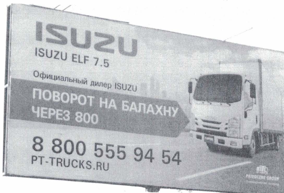
Фото №2: Эскизное изображение рекламной конструкции (сторона А).