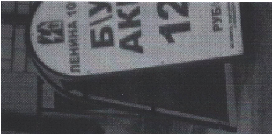
Фото № 2: Эскизное изображение рекламной конструкции