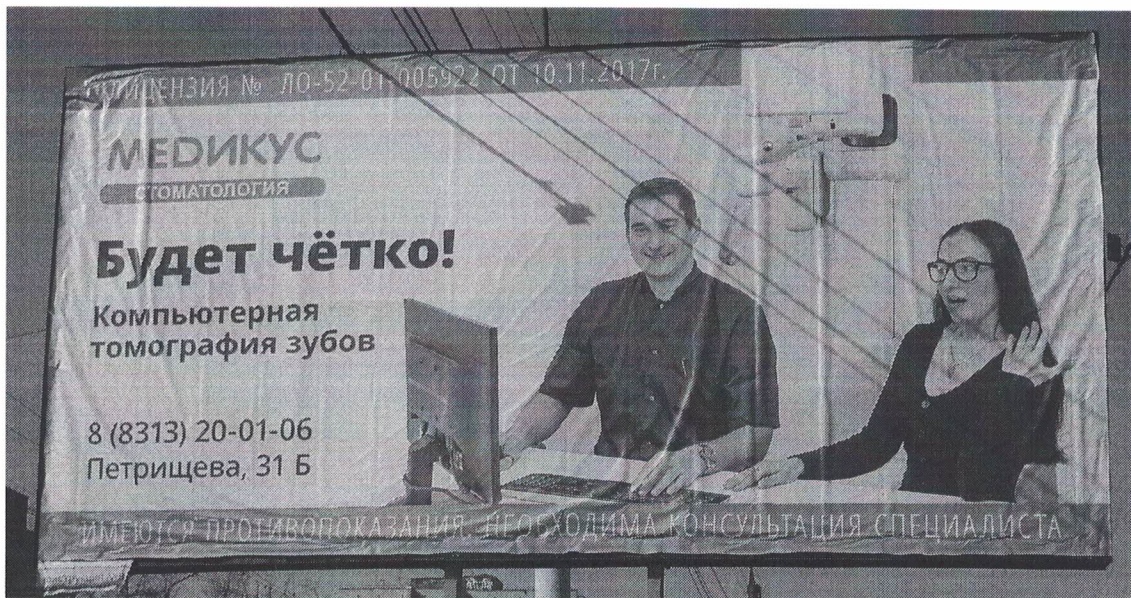
Фото № 2: Эскизное изображение рекламной конструкции, Сторона А.