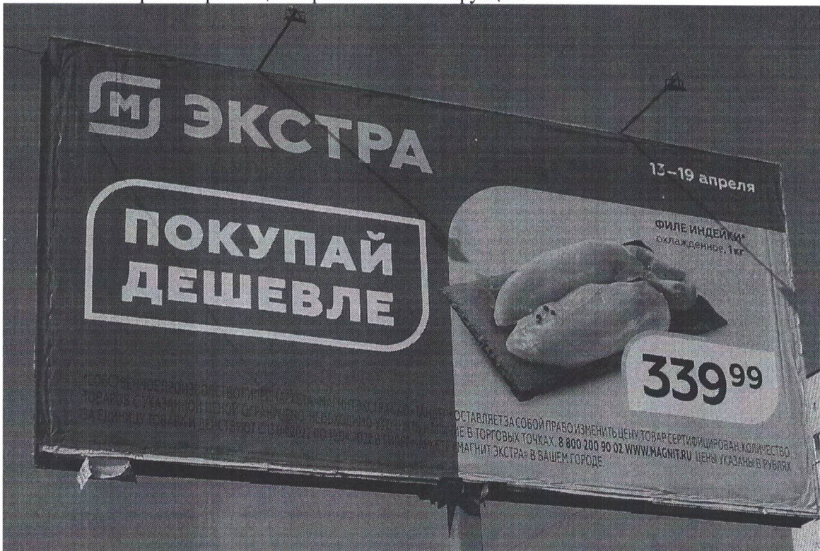
Фото № 2: Эскизное изображение рекламной конструкции, Сторона А.