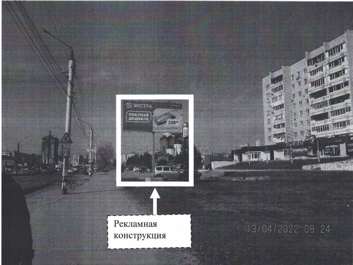
Фото № 1: Панорамное размещение рекламной конструкции.

Фотофиксация места установки (размещения) рекламной конструкции с эскизным изображением «Сторона А: М ЭКСТРА ПОКУПАЙ ДЕШЕВЛЕ Сторона Б: Чистое информационное поле»