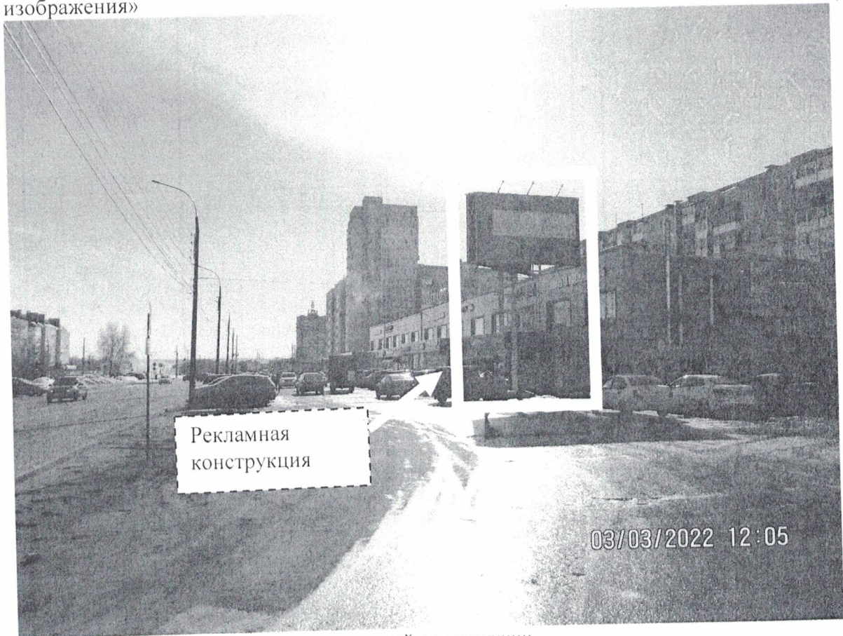
Фото № 1: Панорамное размещение рекламной конструкции.

Фотофиксация места установки (размещения) рекламной конструкции с эскизным изображением «Сторона А: ВАША РЕКЛАМА 8-930-812-39-79 Сторона Б: без изображения»