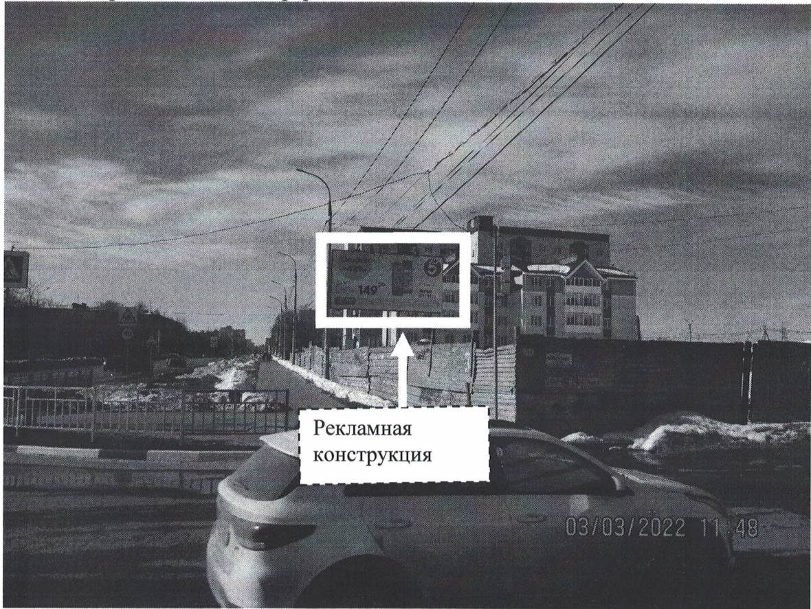
Фото № 1: Панорамное размещение рекламной конструкции.

Фотофиксация места установки (размещения) рекламной конструкции с эскизным изображением «Сторона А: Скидка -43% Шампунь-Бальзам 149,99 1-7 марта Ждем в гости! Сторона Б: Чистое информационное поле»