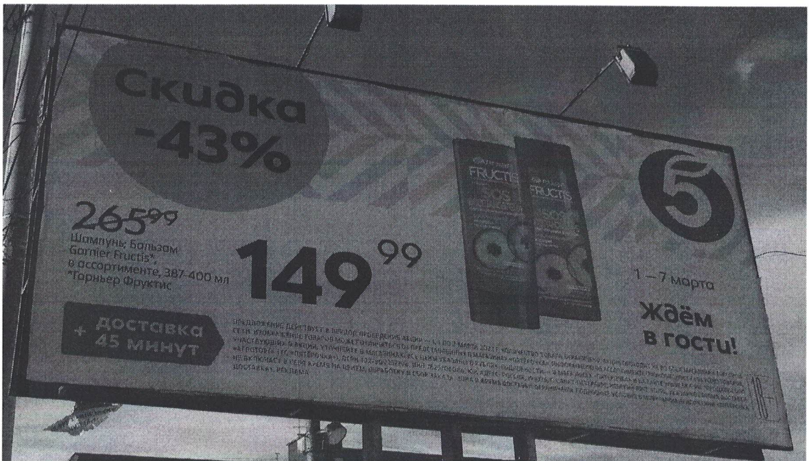
Фото № 2: Эскизное изображение рекламной конструкции, Сторона А.