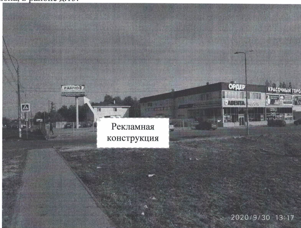
Фото № 1: Панорамный вид размещения рекламной конструкции.

Фотофиксация рекламной конструкции с эскизным изображением: Сторона А: «Загородный клуб Ранчо 636. Место уютного отдыха! Отель***. Торжества и свадьбы. Конгресс-холл. Русские бани. Ночные бани. SPA и фитнес. www.rancho636.ru », Сторона Б: «Загородный клуб Ранчо 636. Место уютного отдыха! Отель***. Торжества и свадьбы. Конгресс-холл. Русские бани. Ночные бани. SPA и фитнес. www.rancho636.ru . 6 км», расположенной по адресу: Нижегородская обл., г. Дзержинск, пр. Ленинского Комсомола, в районе д.13.