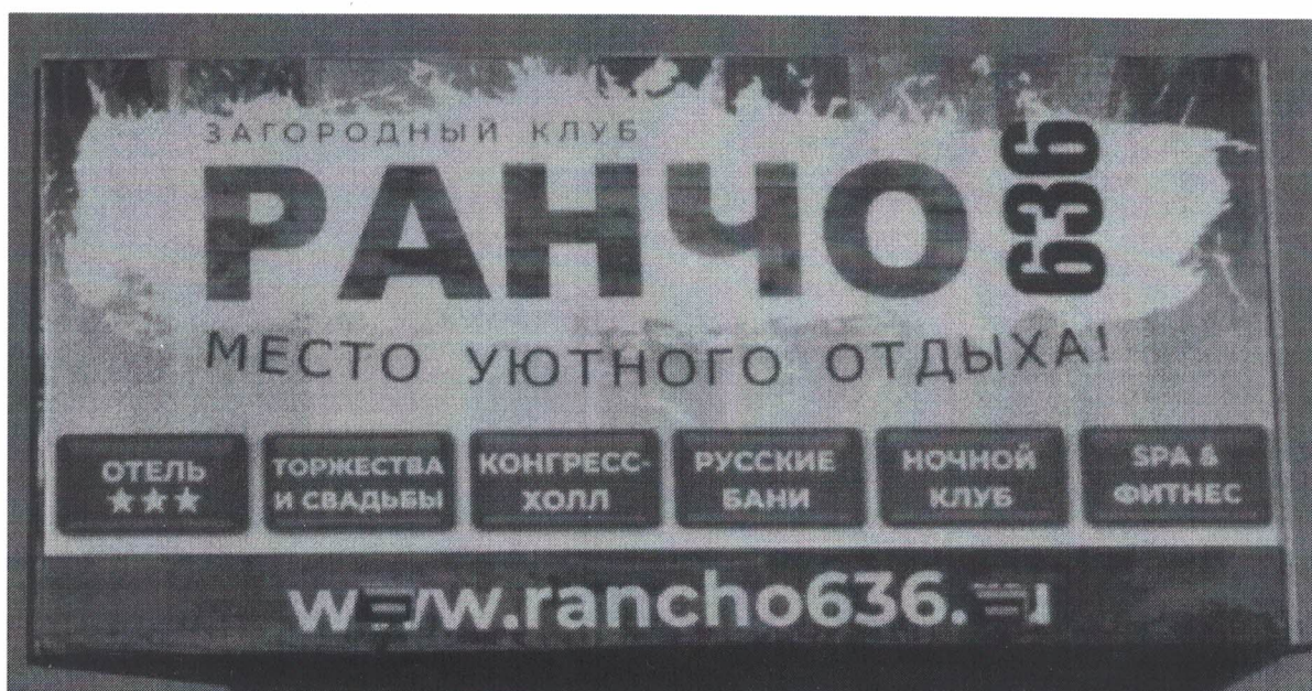
Фото №2: Эскизное изображение рекламной конструкции (сторона А)