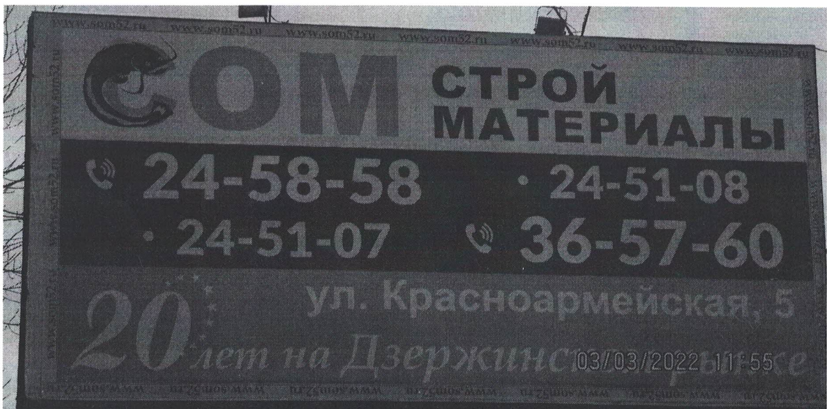
Фото № 2: Эскизное изображение рекламной конструкции, Сторона Б.