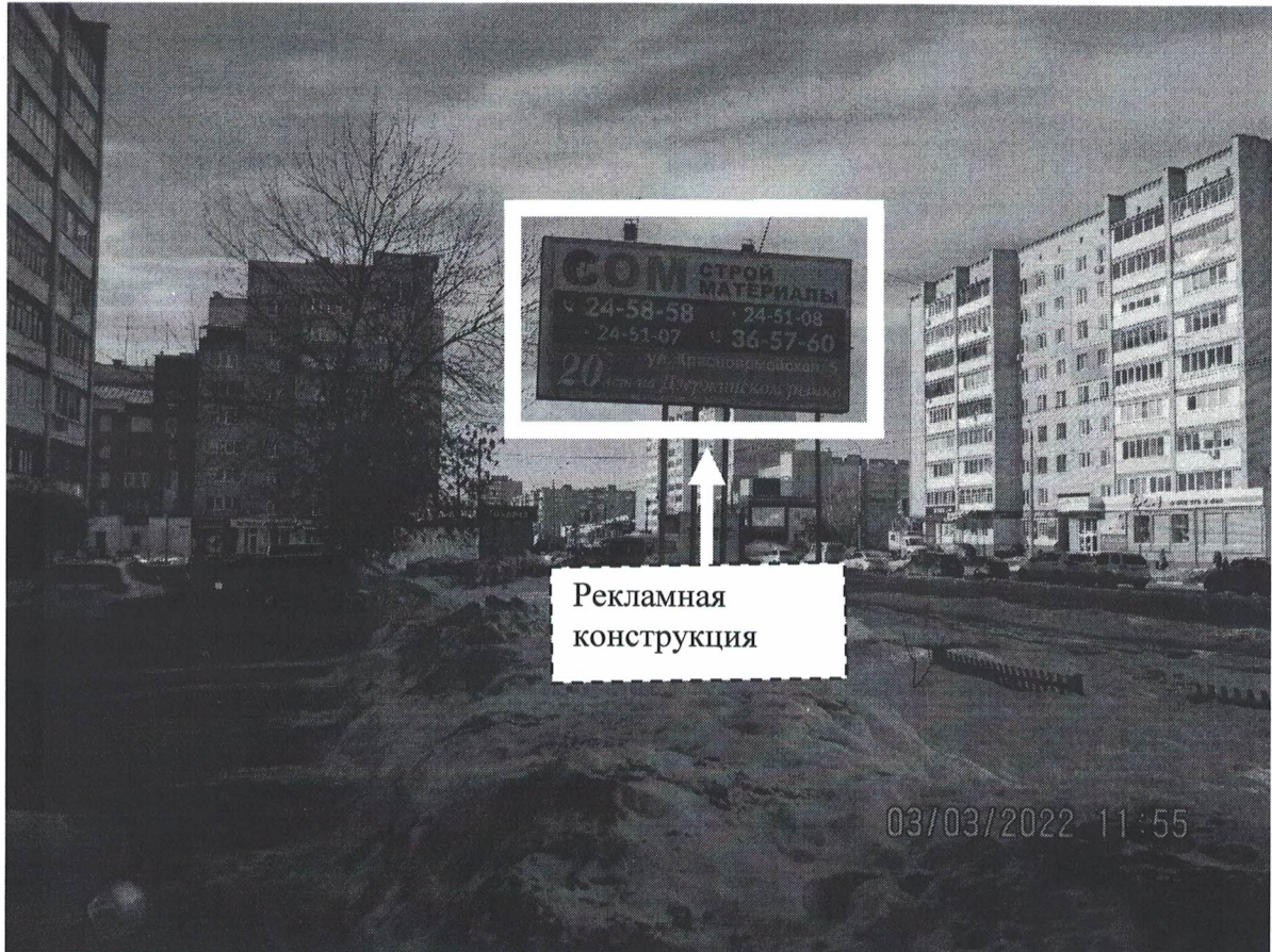
Фото № 1: Панорамное размещение рекламной конструкции.

Фотофиксация места установки (размещения) рекламной конструкции с эскизным изображением «Сторона А: ПРОДАЖА ЖИЛЫХ ДОМОВ в коттеджном поселке Желнино от 8100000 8-905-865-63-41 сторона Б: СОМ Стройматериалы 24-58-58 24-51-07 24-51-08 36-57-60 ул.Красноармейская, 5 20 лет на дзержинском рынке»