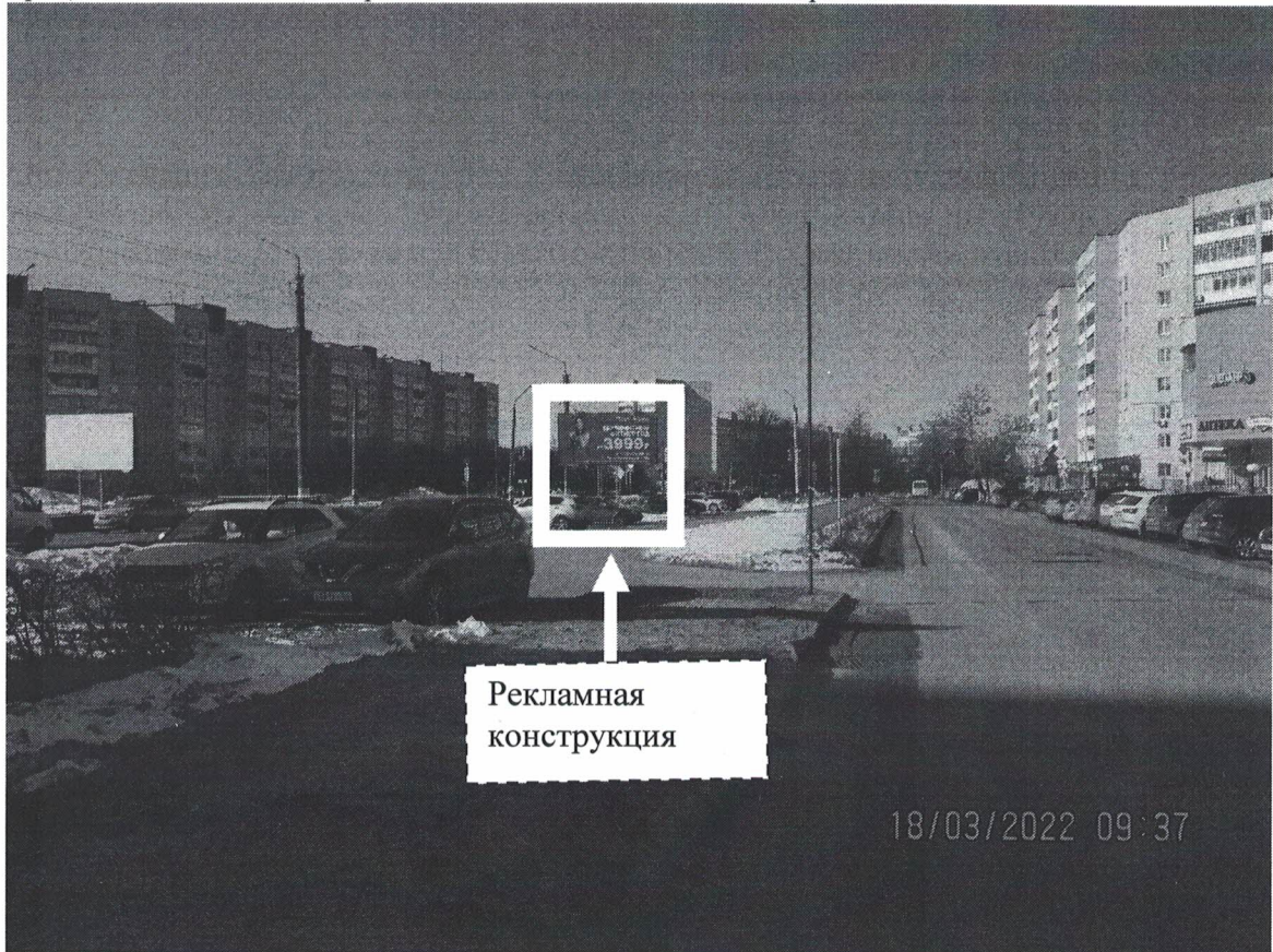
Фото № 1: Панорамное размещение рекламной конструкции.

Фотофиксация места установки (размещения) рекламной конструкции с эскизным изображением «Сторона А: МетроFitness сеть спорт-клубов от 3999р. 8(8313)35-06-96 пр.Циолковского 76А Сторона Б: СШОР САЛЮТ 25 ЛЕТ растим чемпионов»