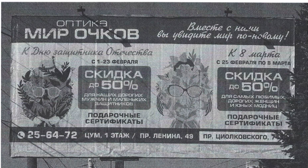
Фото № 2: Эскизное изображение рекламной конструкции, Сторона А.