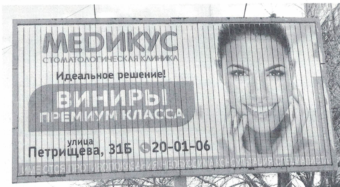
Фото № 2: Эскизное изображение рекламной конструкции, Страна А.