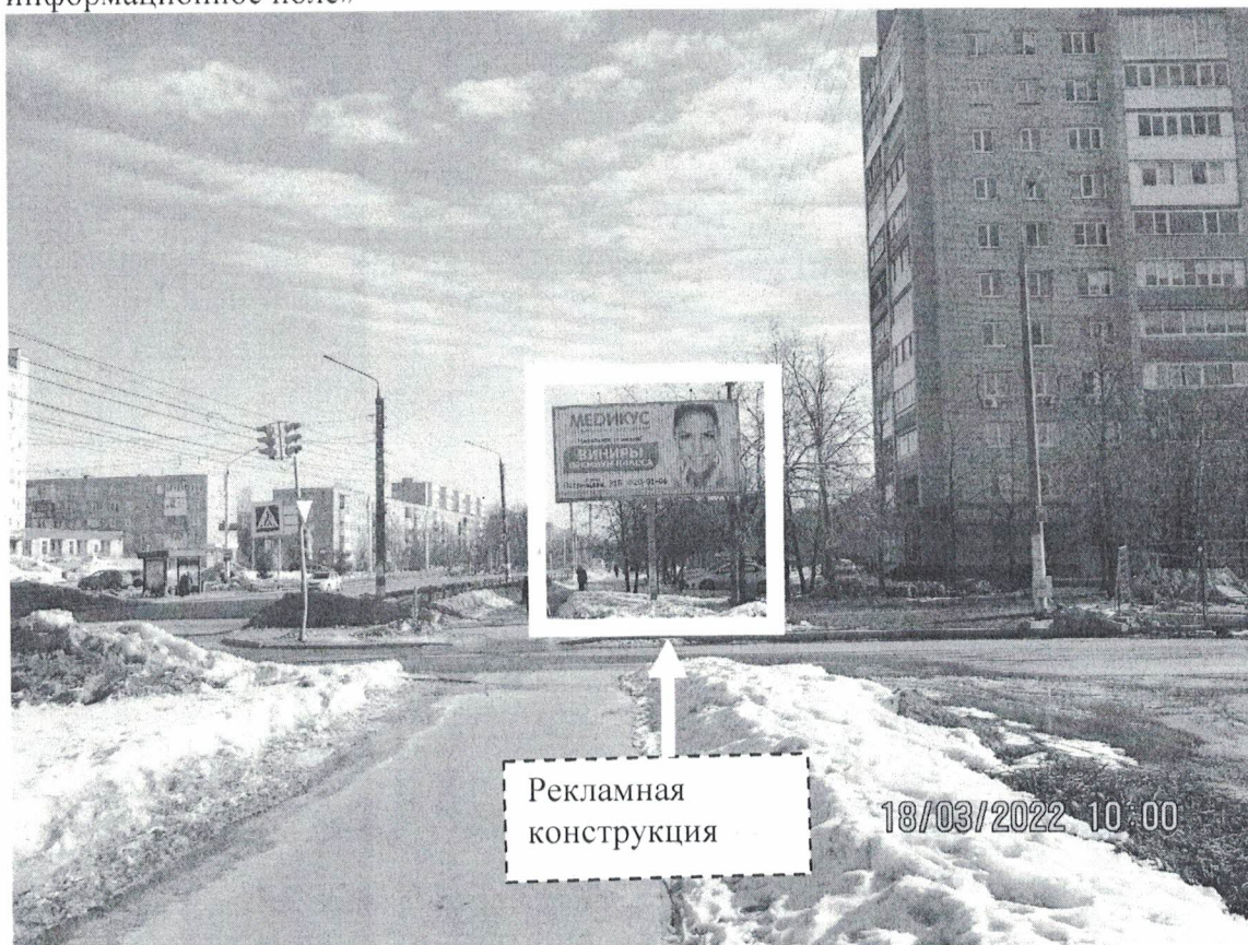
Фото № 1: Панорамное размещение рекламной конструкции.

Фотофиксация места установки (размещения) рекламной конструкции с эскизным изображением «Страна А: МЕДИКУС стоматологическая клиника Идеальное решение! ВИНИРЫ Премиум класса! Ул.Петрищева, 31Б 20-01-06 Страна Б: Чистое информационное поле»