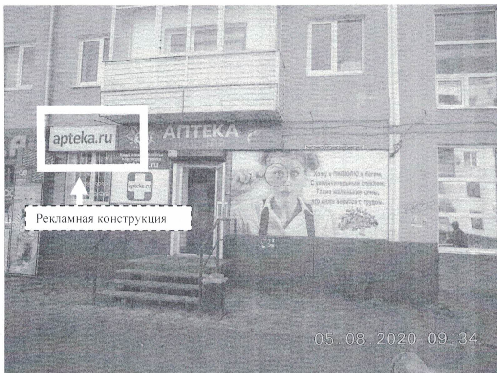
Фото № 1: Панорамный вид размещения рекламной конструкции

Фотофиксация рекламной конструкции размером 0,5х 1,5м. «аптека.ru», расположенной по адресу: Нижегородская обл., г. Дзержинск, пр. Циолковского, д.1.