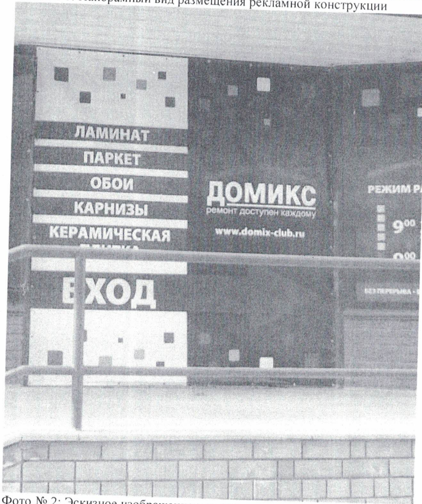
Фото № 2: Эскизное изображение размещения рекламной конструкции