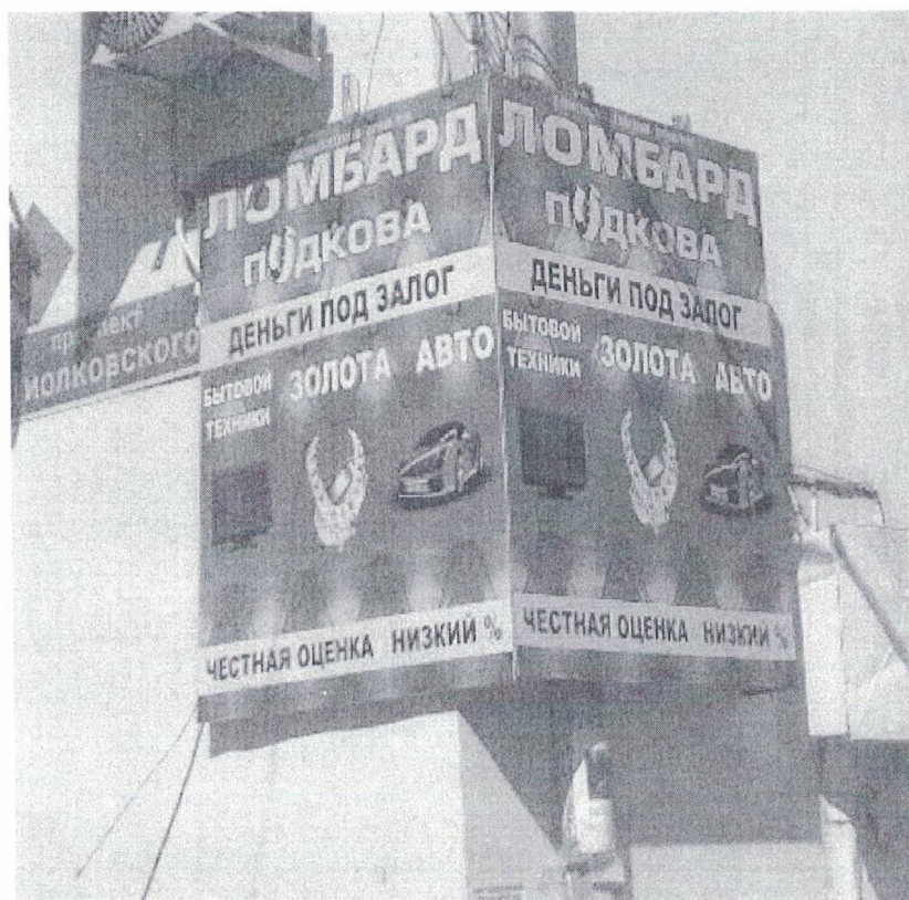
Фото № 2: Эскизное изображение размещения рекламной конструкции