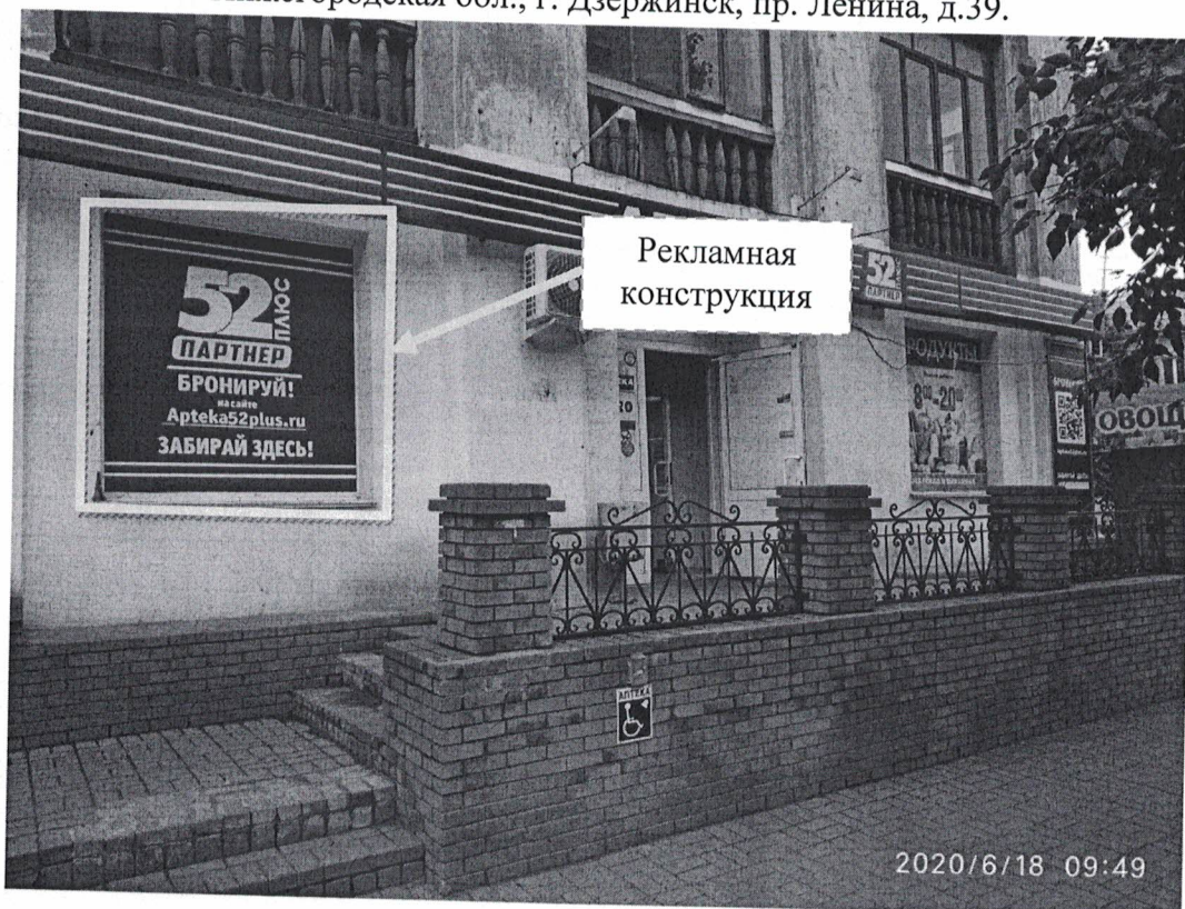
Схема размещения рекламной конструкции с эскизным изображением «52плюс Партнер. Бронируй на сайте arteka52plus.ru . Забирай здесь!», расположенной по адресу: Нижегородская обл., г. Дзержинск, пр. Ленина, д.39

Фотофиксация рекламной конструкции с эскизным изображением «52плюс Партнер. Бронируй на сайте arteka52plus.ru . Забирай здесь!», расположенной по адресу: Нижегородская обл., г. Дзержинск, пр. Ленина, д.39.