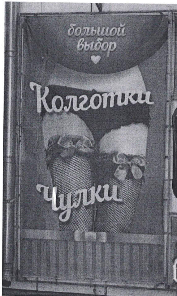
Фото 2: Эскизное изображение рекламной конструкции