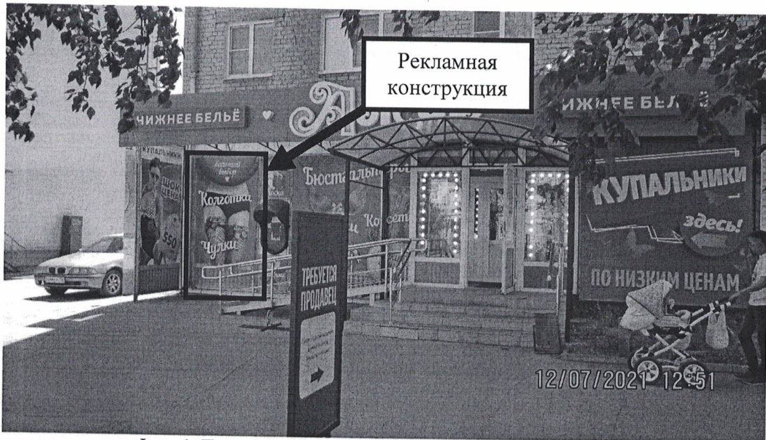
Фото 1: Панорамный вид размещения рекламной конструкции

Фотофиксация рекламной конструкции в виде навесного панно (баннера) с эскизным изображением «Огромный выбор. Колготки. Чулки.» , расположенной по адресу: Нижегородская обл., г. Дзержинск, пр. Ленина, д.30.