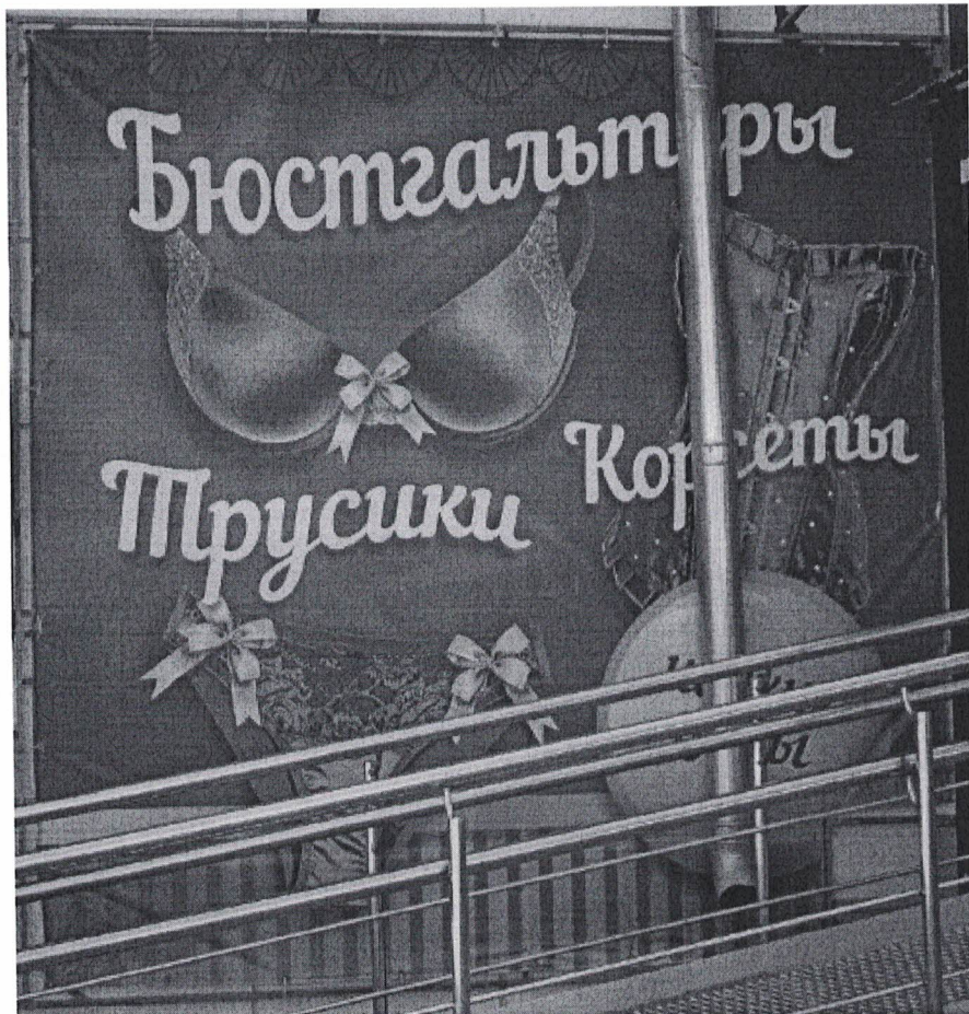
Фото 2: Эскизное изображение рекламной конструкции