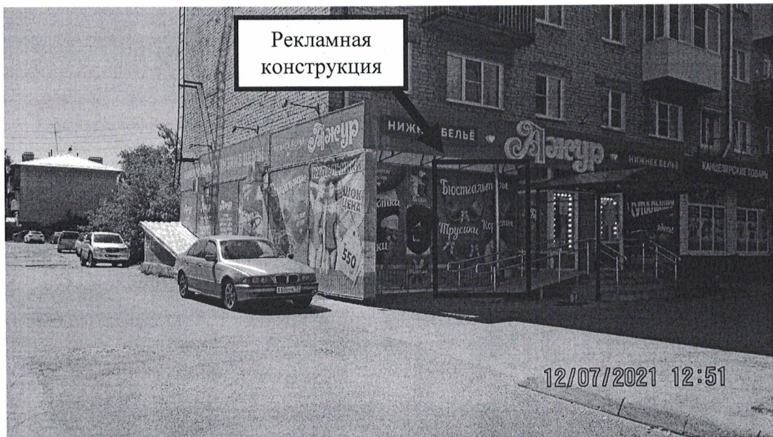
Фото 1: Панорамный вид размещения рекламной конструкции

Фотофиксация рекламной конструкции в виде навесного панно (баннера) с эскизным изображением «Бюстгалтеры, трусики, корсеты. Низкие цены.» , расположенной по адресу: Нижегородская обл., г. Дзержинск, пр. Ленина, д.30.