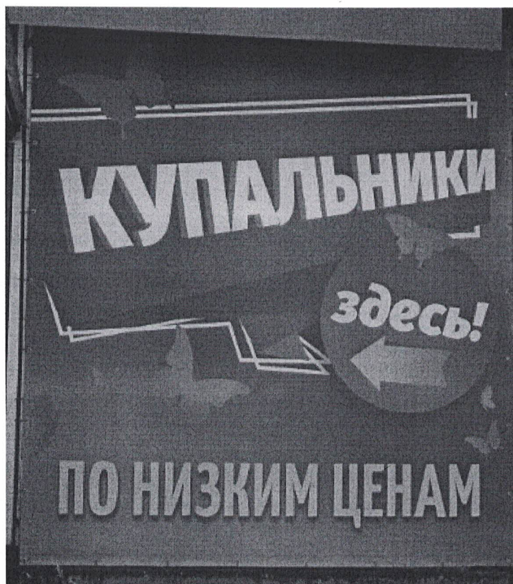
Фото 2: Эскизное изображение рекламной конструкции