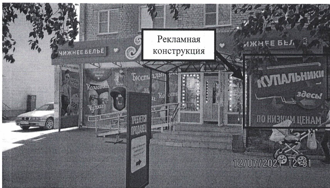
Фото 1: Панорамный вид размещения рекламной конструкции

Фотофиксация рекламной конструкции в виде навесного панно (баннера) с эскизным изображением «Купальники здесь по низким ценам.» , расположенной по адресу: Нижегородская обл., г. Дзержинск, пр. Ленина, д.30.