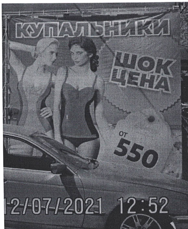
Фото 2: Эскизное изображение рекламной конструкции