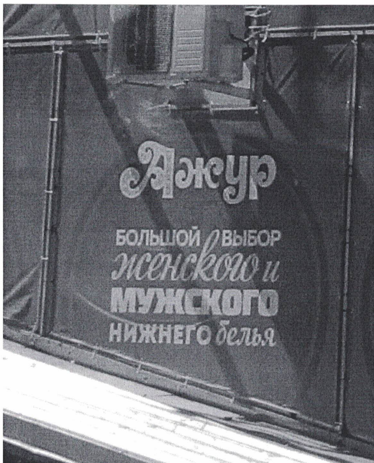
Фото 2: Эскизное изображение рекламной конструкции