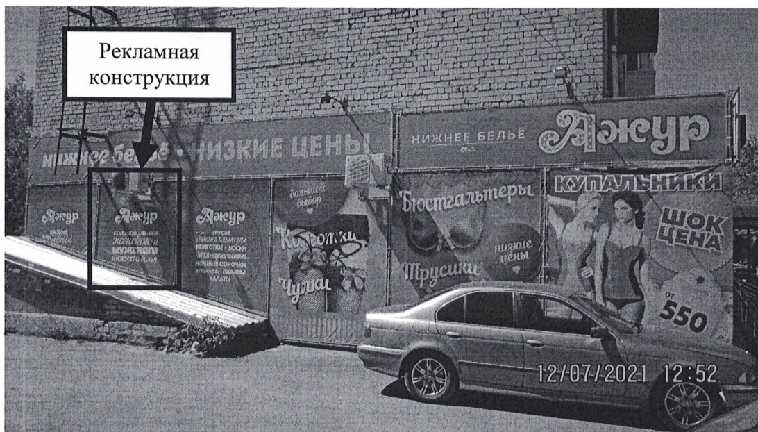
Фото 1: Панорамный вид размещения рекламной конструкции

Фотофиксация рекламной конструкции в виде навесного панно (баннера) с эскизным изображением «Ажур. Большой выбор мужского и женского нижнего белья», расположенной по адресу: Нижегородская обл., г. Дзержинск, пр. Ленина, д.30.