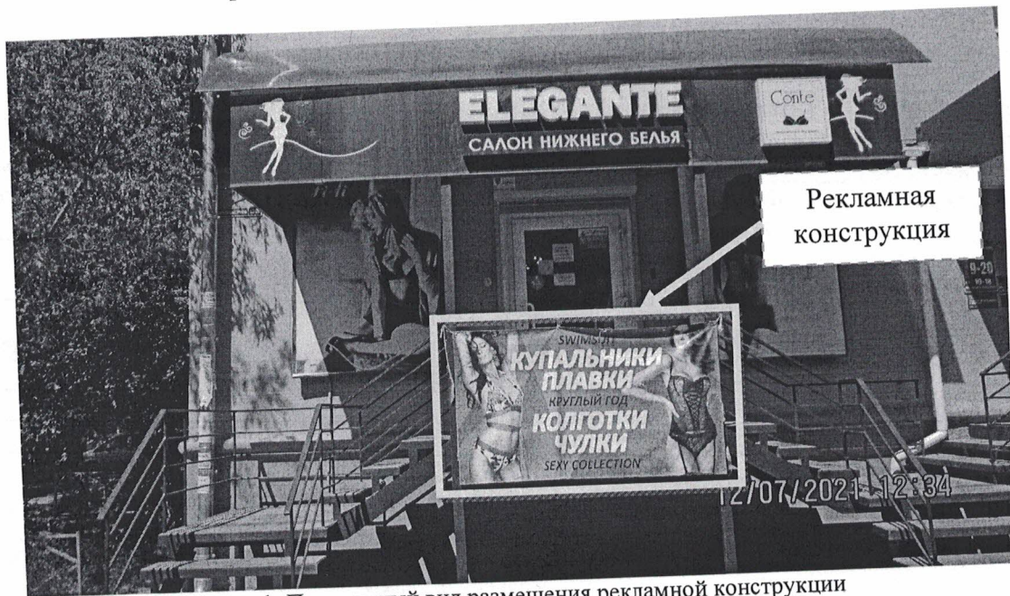
Фото 1: Панорамный вид размещения рекламной конструкции

Фотофиксация рекламной конструкции в виде навесного панно (баннера) с изображением женщин в нижнем белье и надписью «Swimsuit Плавки купальники круглый год колготки чулки sexy collection», расположенной по адресу: Нижегородская обл., г. Дзержинск, пр. Циолковского, д.12.