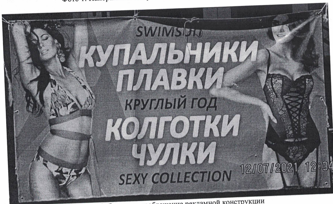
Фото 2: Эскизное изображение рекламной конструкции