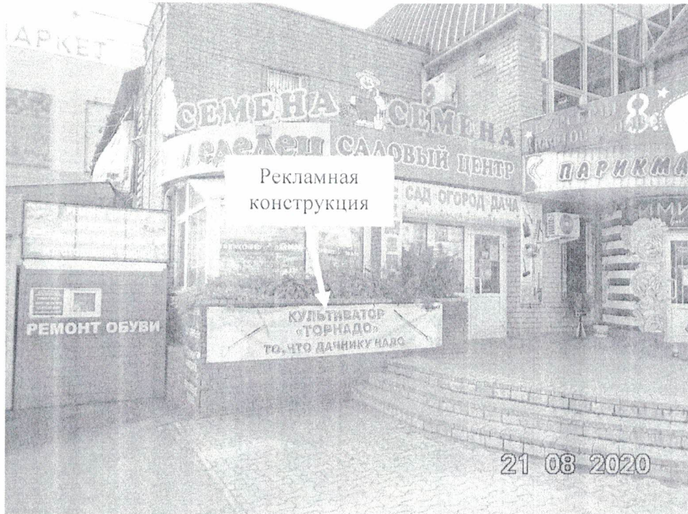
Фото № 1: Панорамный вид размещения рекламной конструкции.

Фотофиксация рекламной конструкции с эскизным изображением «Культиватор «Торнадо» то, что дачнику надо», расположенной по адресу: Нижегородская обл., г. Дзержинск, ул. Гайдара, в районе д.59В.