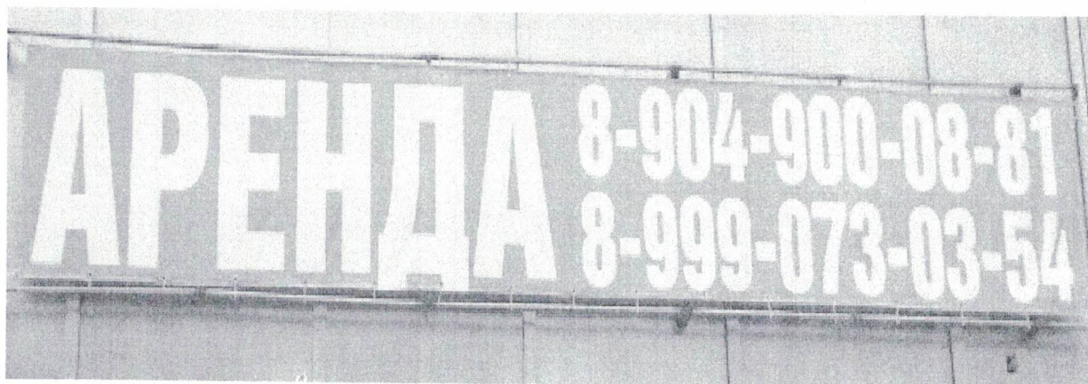
Фото №2: Эскизное изображение рекламной конструкции