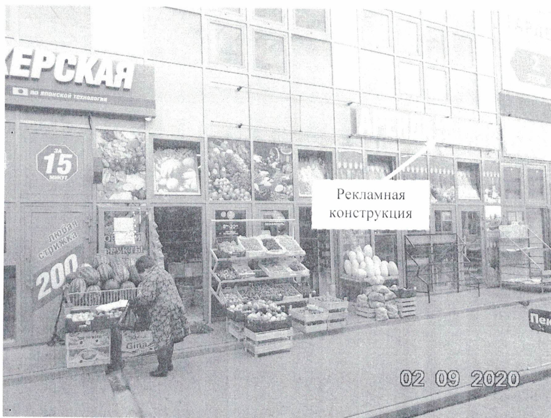
Фото № 1: Панорамный вид размещения рекламной конструкции.

Фотофиксация рекламной конструкции с эскизным изображением «Аренда 8-904-900-08-81, 8-999-073-03-54», расположенной по адресу: Нижегородская обл., г. Дзержинск, ул. Гайдара, д.59Е.