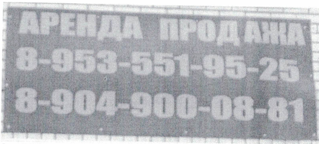
Фото №2: Эскизное изображение рекламной конструкции