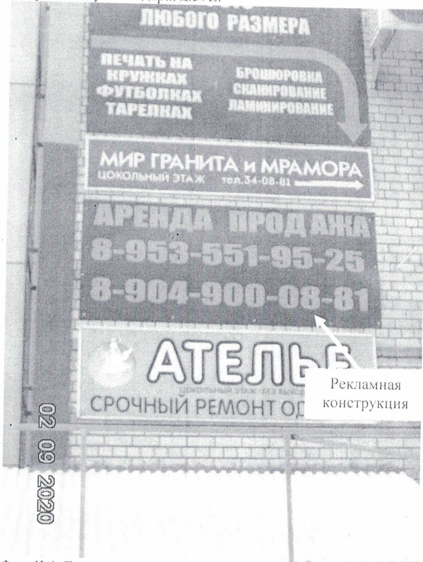
Фото № 1: Панорамный вид размещения рекламной конструкции.

Фотофиксация рекламной конструкции с эскизным изображением «Аренда продажа 8-953-551-95-25, 8-904-900-08-81», расположенной по адресу: Нижегородская обл., г. Дзержинск, ул. Гайдара, д.59Е.