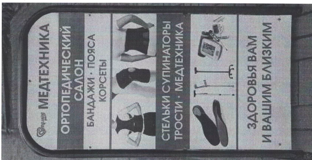
Фото № 2: Эскизное изображение рекламной конструкции