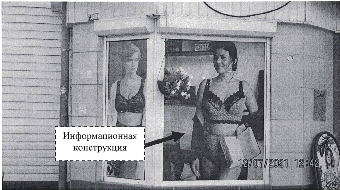
Схема установки информационной конструкции размером 1,5 x 2,0 м с изображением женщины в нижнем белье, расположенной по адресу: г. Дзержинск, проспект Циолковского, д.19.

Фотофиксация информационной конструкции размером 1,5 x 2,0 м с изображением женщины в нижнем белье, расположенной по адресу: г. Дзержинск, проспект Циолковского, д.19.