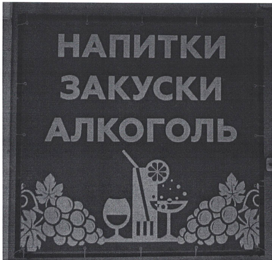
Фото 2: Эскизное изображение информационной конструкции.