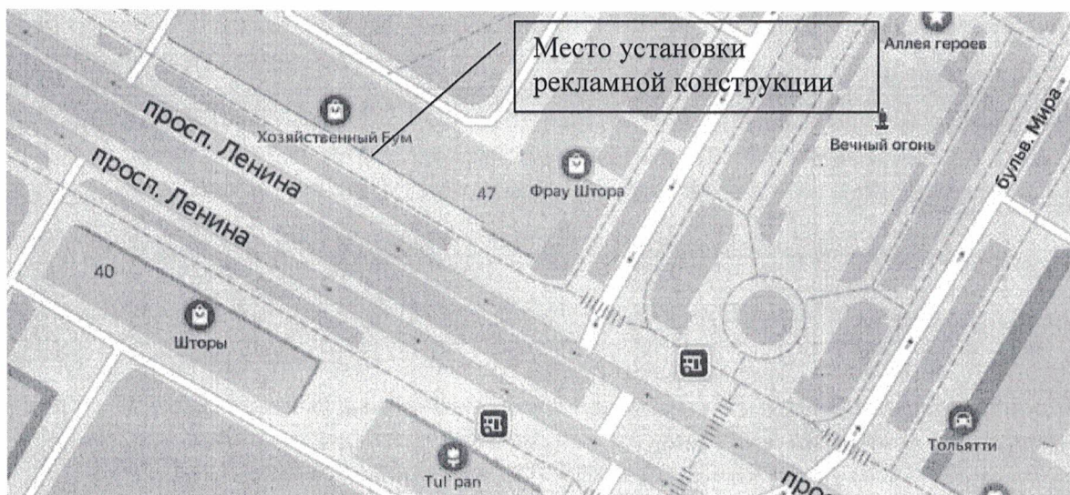
Схема установки (размещения) рекламной конструкции с эскизным изображением «Одежда для школы, рубашки, брюки, жилеты, к школе готовы!», расположенной по адресу: Нижегородская обл., г. Дзержинск, пр. Ленина, д.47