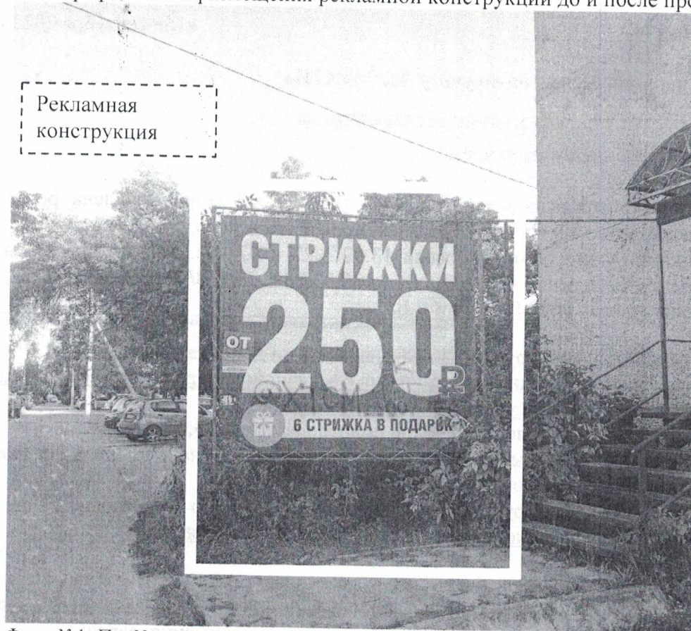
Фото №1: Пр. Циолковского, д. 50 до проведения работ по демонтажу.