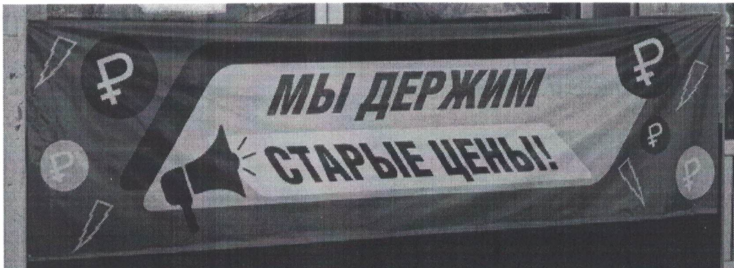
Фото № 2: Эскизное изображение рекламной конструкции