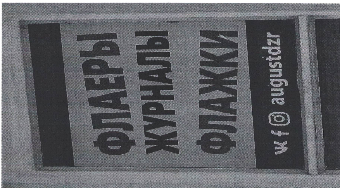
Фото № 2: Эскизное изображение рекламной конструкции