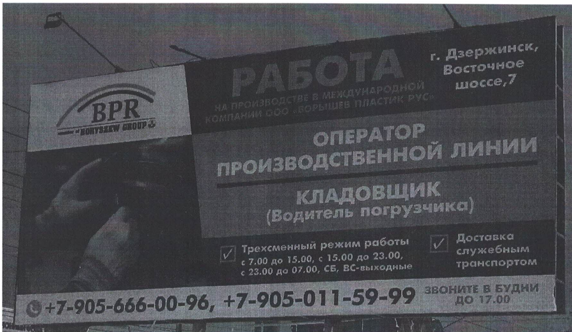
Фото № 2: Эскизное изображение рекламной конструкции Сторона А.