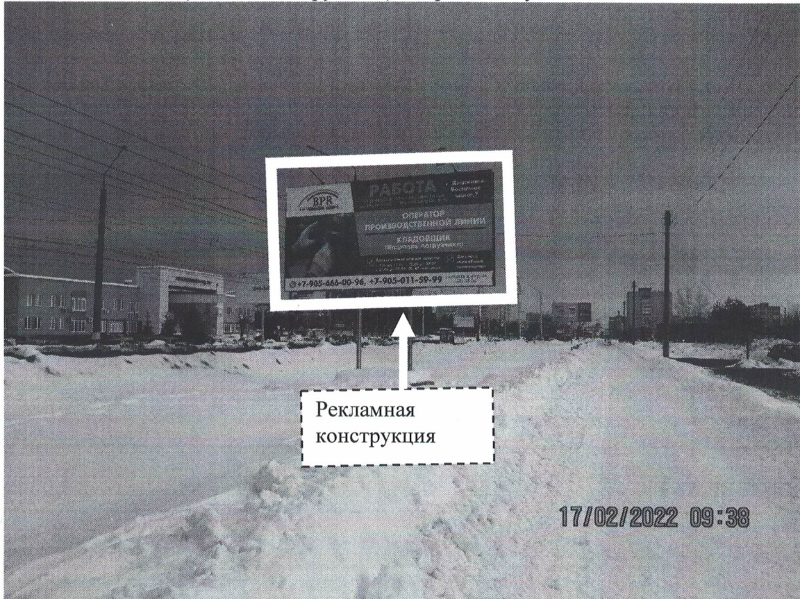
Фото № 1: Панорамное размещение рекламной конструкции Сторона А.

Фотофиксация места установки (размещения) рекламной конструкции с эскизным изображением «Сторона А: Работа на производстве в международной компании ООО "Борышев пластик рус" г.Дзержинск Восточное шоссе, 7 Оператор производственной линии Кладовщик (водитель погрузчика) Сторона Б: Пустое поле»