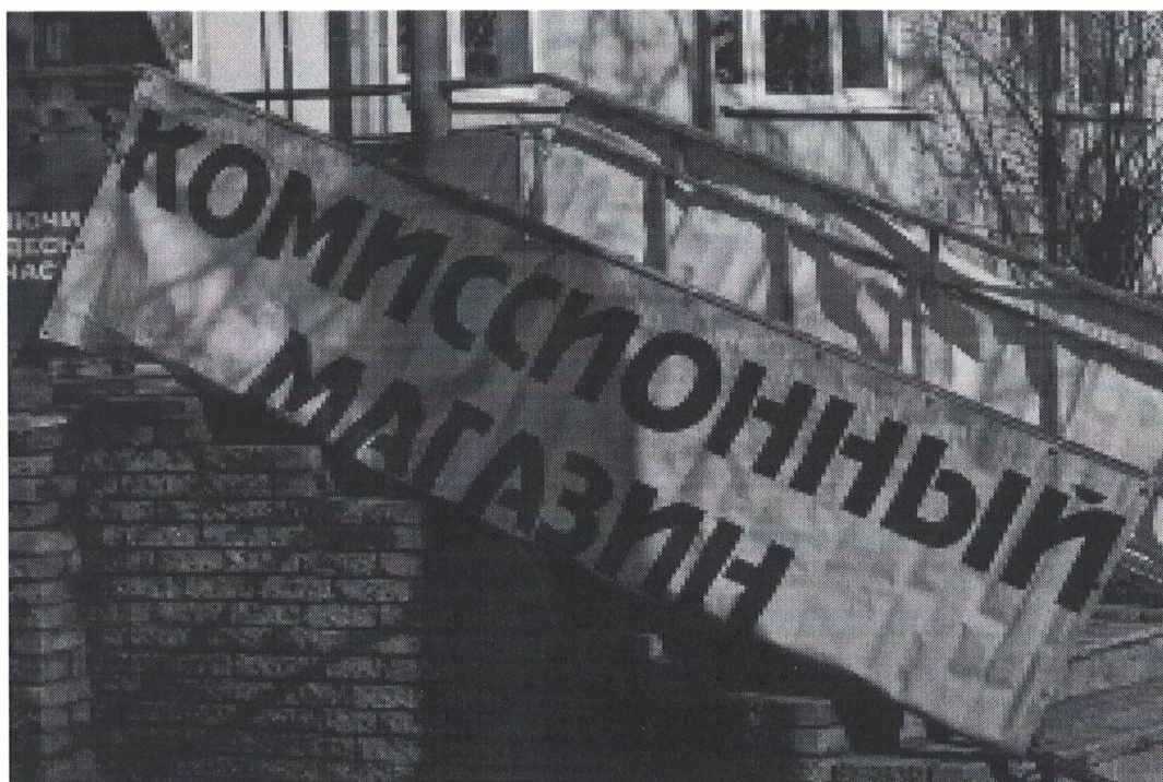
Фото № 2: Эскизное изображение рекламной конструкции