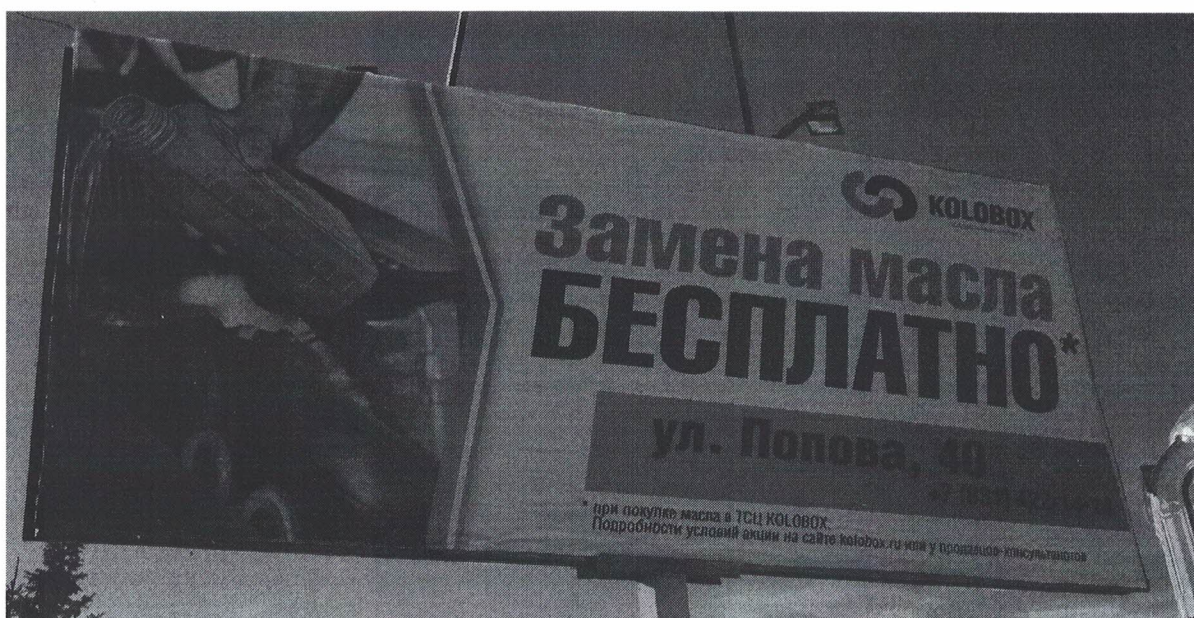
Фото № 2: Эскизное изображение рекламной конструкции, Сторона А.