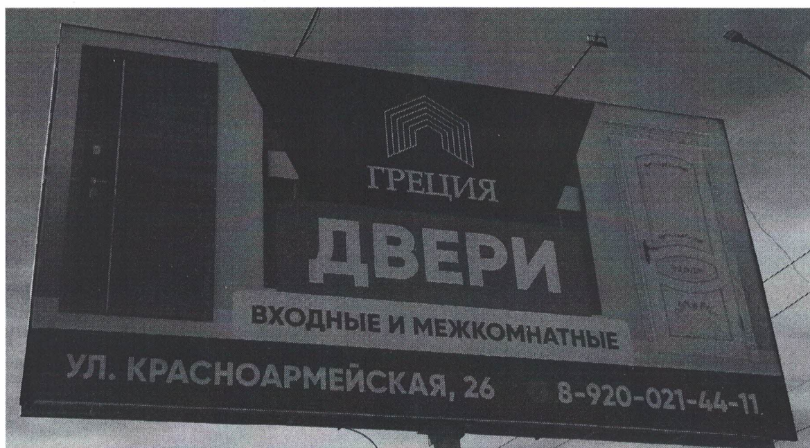
Фото № 2: Эскизное изображение рекламной конструкции, Сторона А.