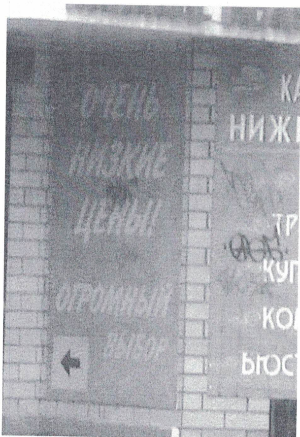
Фото №2: Эскизное изображение рекламной конструкции