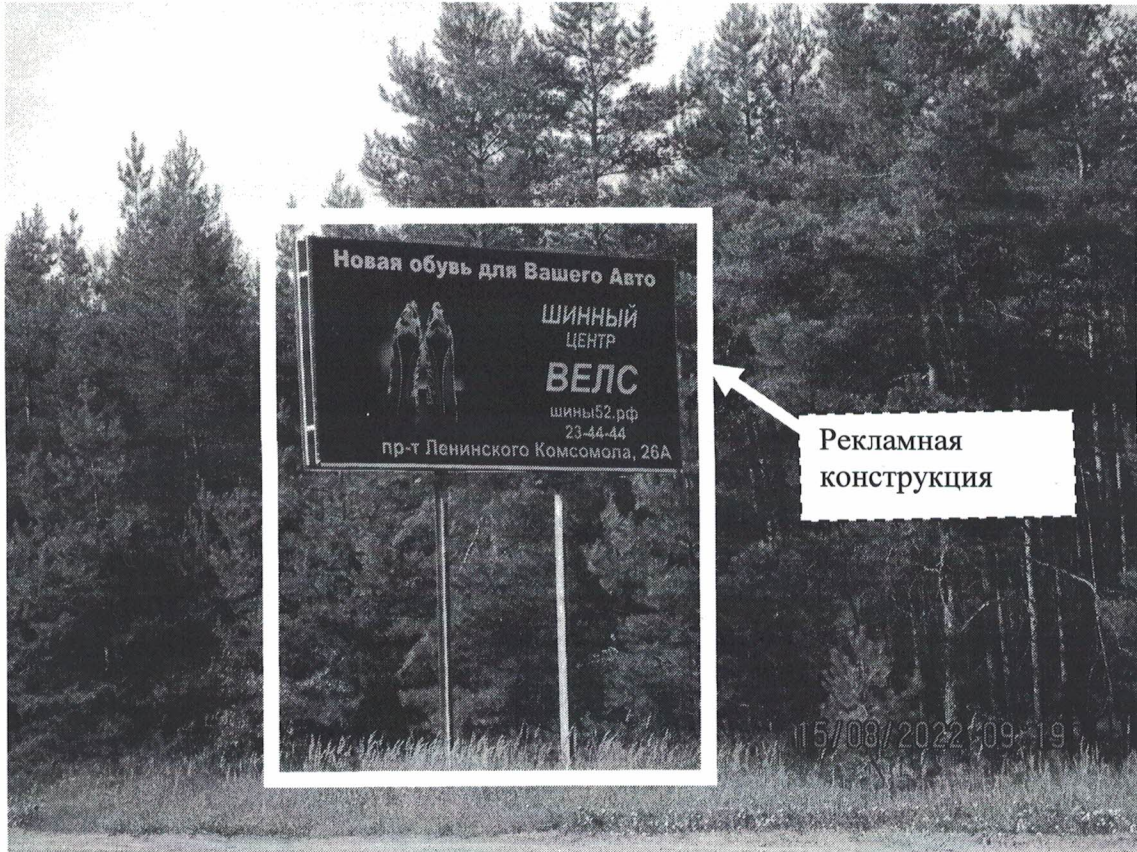
Фото № 1: Панорамное размещение рекламной конструкции.

Фотофиксация места установки (размещения) рекламной конструкции с эскизным изображением «Сторона А: Новая обувь для Вашего Авто Шинный центр ВЕЛС Шины52.рф, 23-44-44 пр.Ленинского Комсомола 26А Сторона Б: Новая обувь для Вашего Авто Шинный центр ВЕЛС Шины52.рф, 23-44-44 пр.Ленинского Комсомола 26А»