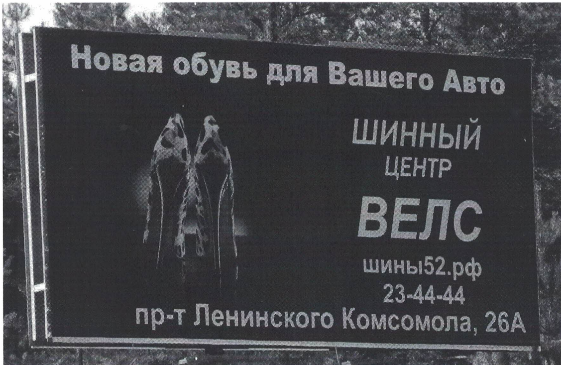
Фото № 2: Эскизное изображение рекламной конструкции, Сторона А.