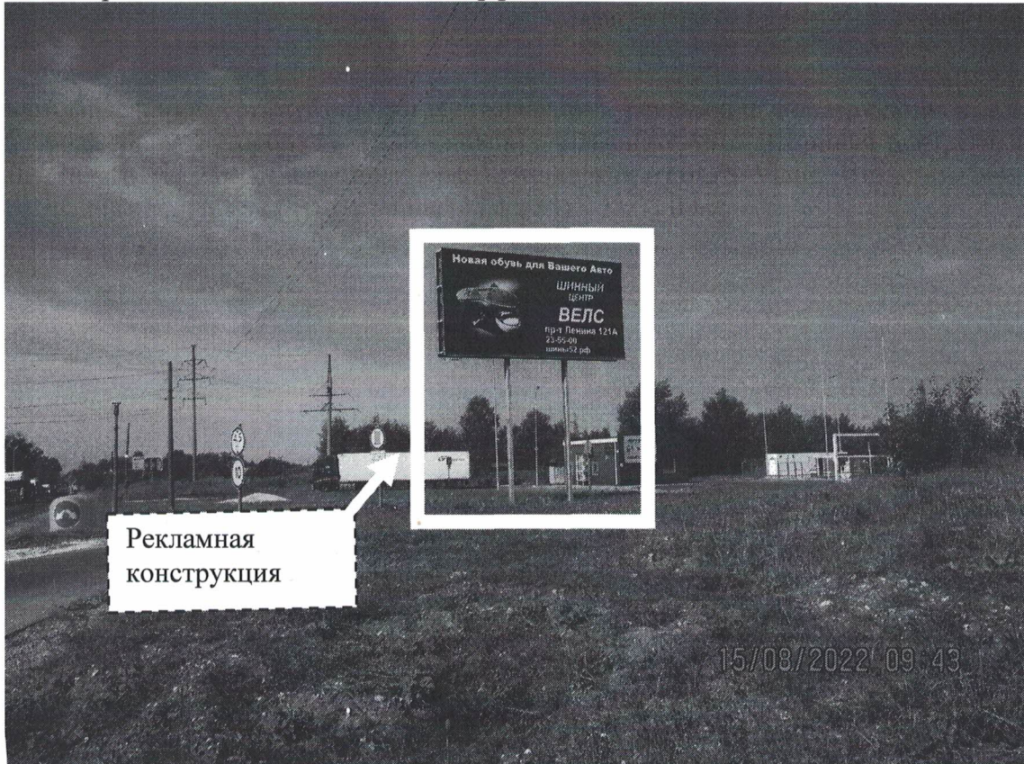
Фото № 1: Панорамное размещение рекламной конструкции.

Фотофиксация места установки (размещения) рекламной конструкции с эскизным изображением «Сторона А: Новая обувь для Вашего Авто Шинный центр ВЕЛС пр-т Ленина 121А 23-55-00 Шины52.рф, Сторона Б: TIRES Viatll Шиномонтаж 0 руб. ВЕЛС пр.Ленина д.121 www.шины52.рф 88313 23 55 00»