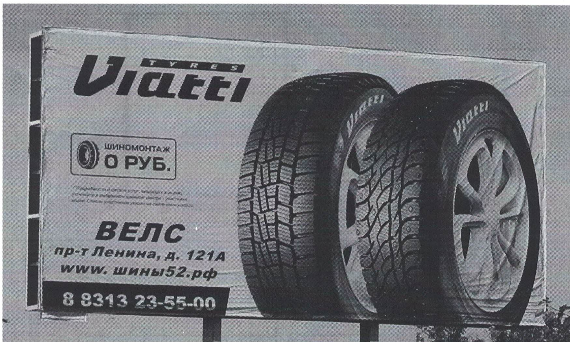
Фото № 2: Эскизное изображение рекламной конструкции, Сторона А.