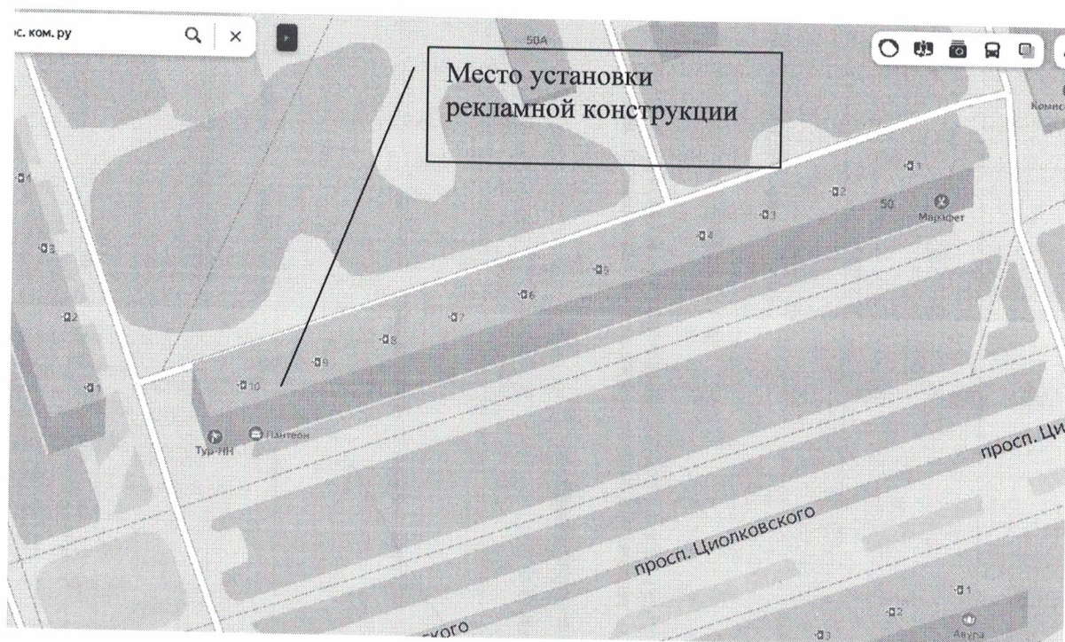
Схема установки рекламной конструкции размером 1,5 м х 2,0 м с эскизным изображением «ПАНТЕОН» Агентство недвижимости 8908-238-51-22», расположенной по адресу: г. Дзержинск, пр-т Циолковского, д. 50.