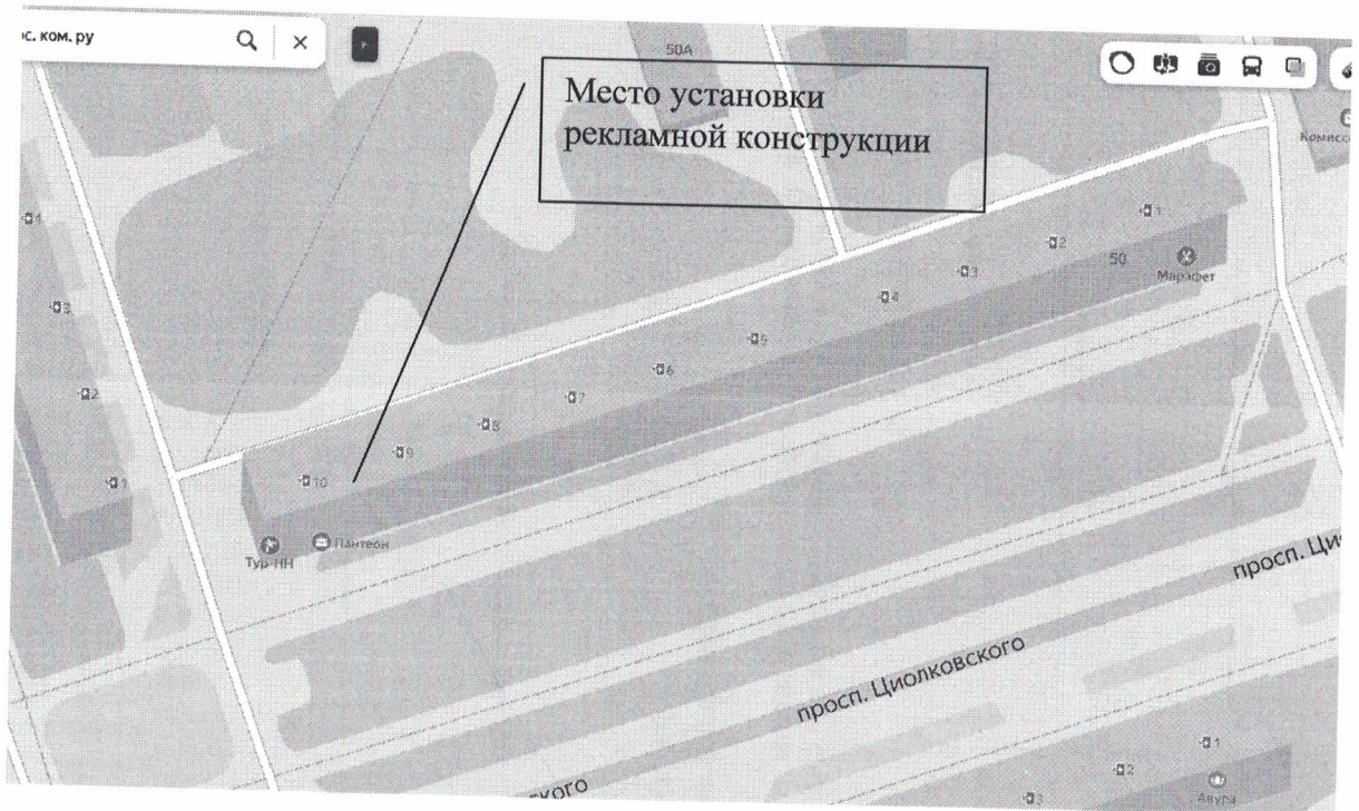
Схема установки рекламной конструкции размером 1,5 м х 2,0 м с эскизным изображением «ПАНТЕОН» Агентство недвижимости 8908-238-51-22», расположенной по адресу: г.Дзержинск, пр-т Циолковского, д. 50.